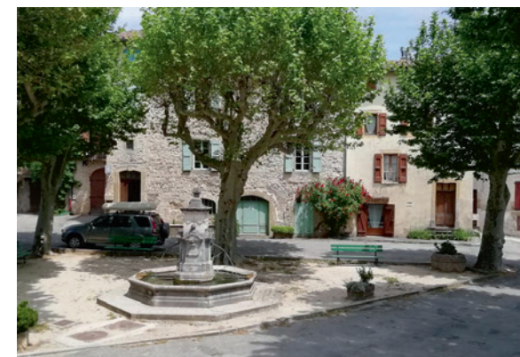
Visuel Pays vignais