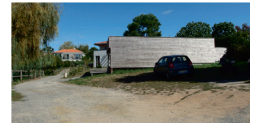
Photos de l'existant