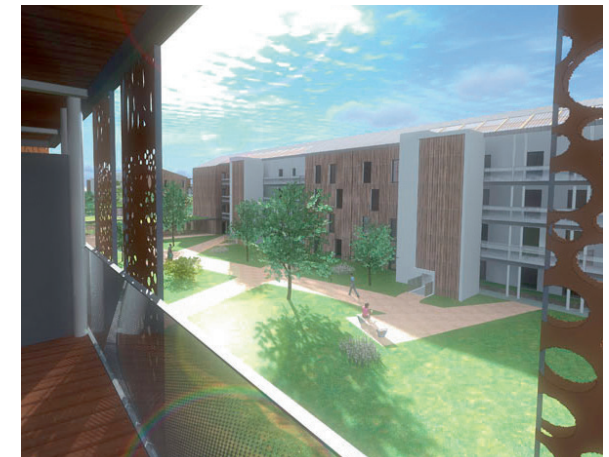
Visuels Pellegrino Architecture