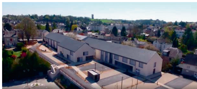
Visuel Val Touraine Habitat