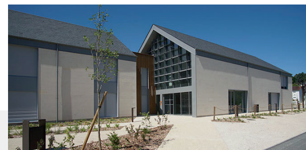
Visuels Aristée architectes